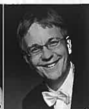
ミヒヤエル・コフラー