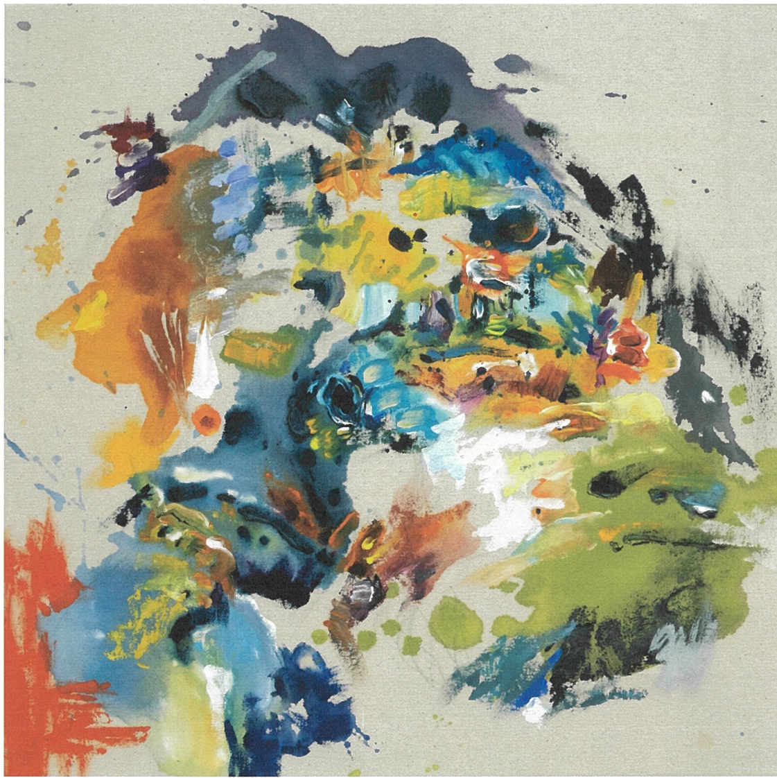
Artwork Anne Kagioka Rigoulet Element b-7, 2021 Acrylic on canvas

コンサートホールで聴く、最上のアコースティック・ミュージック・シリーズ | Vol. 1