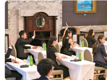
アーティスト研修会(2023年)