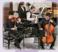
大江馨 [ヴァイオリン] 岡本侑也 [チェロ] 反田恭平 [ピアノ]