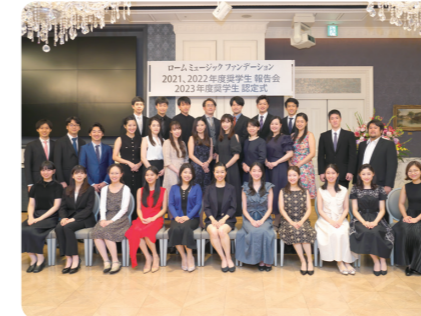
認定式・報告会(2023年)

奨学生に採択された方は、スカラシップ コンサートのほか、認定式・報告会、懇親会、アーティスト研修会などさまざまな行事にご参加いただくことができます。