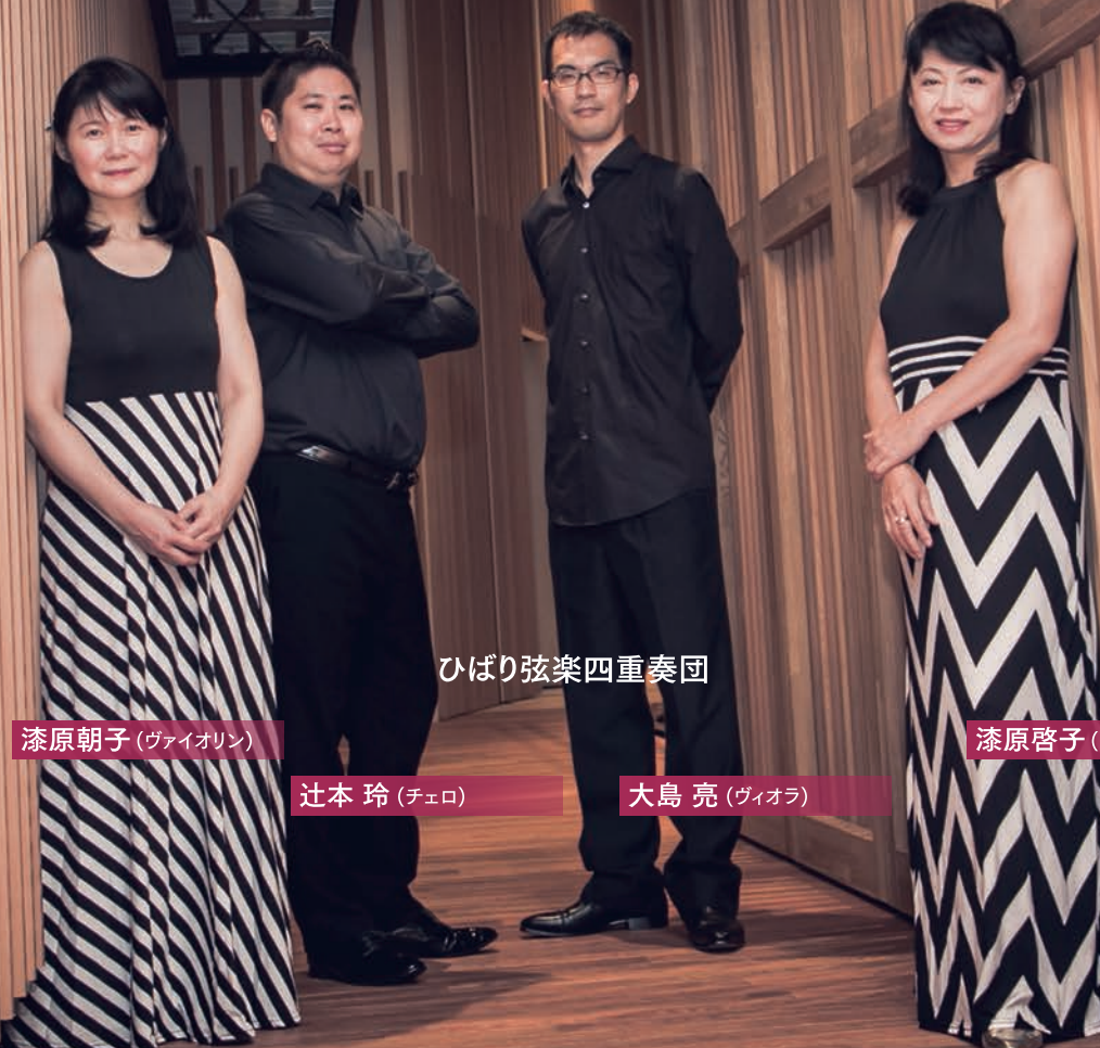
ひばり弦楽四重奏団

浜離宮朝日ホール 〒104-8011 東京都中央区築地5-3-2 朝日新聞東京本社・新館2階